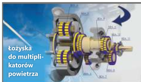
Łożyska do multi-katorów powietrza

STANY MAGAZYNOWE (WYSZUKIWARKA): lozyska-wielkogabarytowe-ekspres.pl