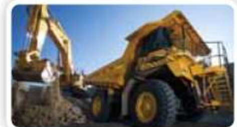
6% Aplikacje w pojazdach pozadrogowych