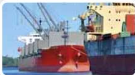
12% Przemysł morski, przybrzeżny i platformy wiertnicze