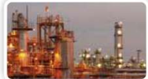
3% Przemysł tworzyw sztucznych: chemia, plastik i guma