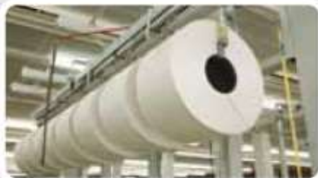
5% Celulozownie, drukarnie, papiernie