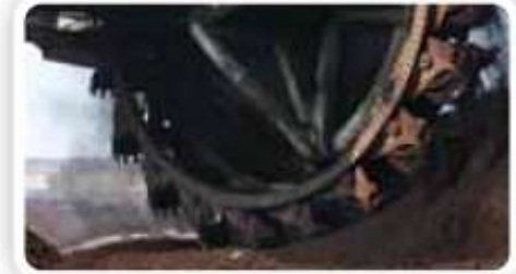
15% Kopalnie i minerały