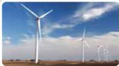
5% Energia odnawialna i tradycyjna