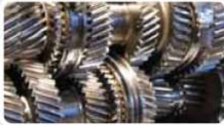
18% Przekłócenie mocy