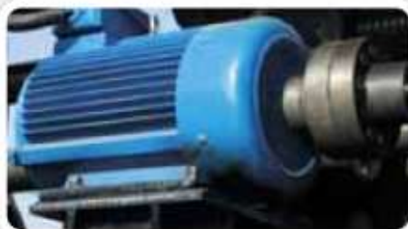
6% Silniki elektryczne, przemysłowe wentylatory, pompy